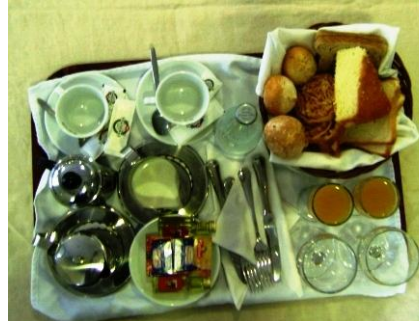
Imagen de montaje

El material necesario para este tipo de servicios es el mismo que en los casos anteriores, eliminado la bandeja, y añadiendo mantel y cubremantel.